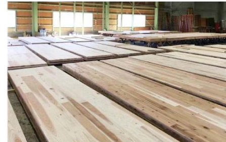
【CLTの選定】一枚ずつ風合いを確認し、使用箇所を選定