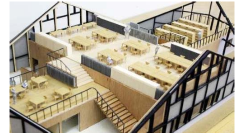
【十字形の平面計画】屋根形状や円形道路に呼応するシンメトリーな十字平面