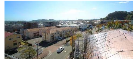
【屋根】放射状に広がる住宅街とシネジック社屋の特徴的な銅板屋根