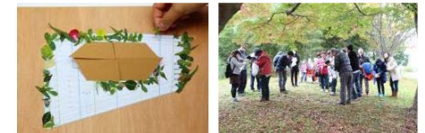
【緑化計画】地域固有の在来種のタネをワークショップで集め敷地内で育てる計画