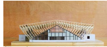
【連続するトラス】平面トラスが徐々に角度を変えながら曲面屋根を構成

宮城県富谷市成田9-1-19 022-351-7330 http://www.synegetic.co.jp