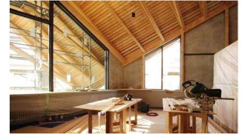
【大きな屋根】手の届く位置から始まる木架構が連続して、大きな屋根を作る